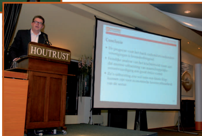
De pittige conclusies en aanbevelingen van het onderzoek