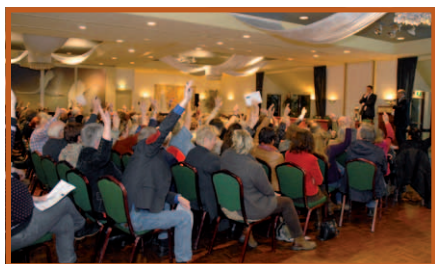
▲ Discussie met de zaal