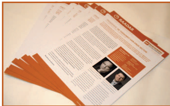
De uitnodiging voor de presentatie