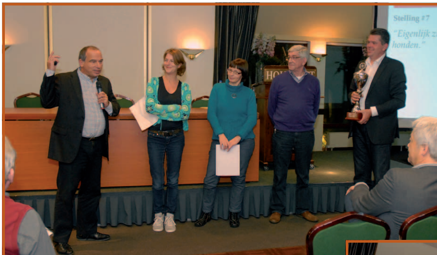
De 3 finalisten van de InfoToto