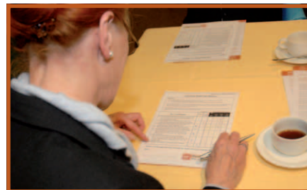
Bij de ontvangst kreeg men het Infototo formulier om in te vullen