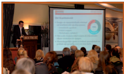
De presentatie van de resultaten van het onderzoek