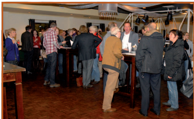
De presentatie gaf volop stof tot nadenken en nabespreken